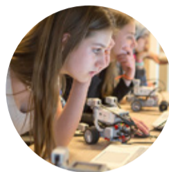
ICT & Techniek